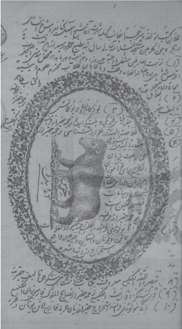
تصویر ۱. روی جلد کتاب المقوم، مهمل التقويم

از لاتین و یونانی و آلمانی و غیره)، تبصرة اللغة انگلیسی (تألیف)، ڈی کینگز ادوایت انگلیسی (ترجمه از نصایح الملوك فارسی به زبان انگلیسی)، آتی مولوژی فرانسه (استخراج از منابع عربی، فارسی، لاتین، یونانی و غیره)، گرامر زبان سرستان و مجارستان (ترجمه از فرانسه به فارسی) و تاریخ مقدماتی (ترجمه از زبان انگلیسی). ۲