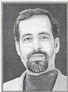
** سید مهدی جهرمی