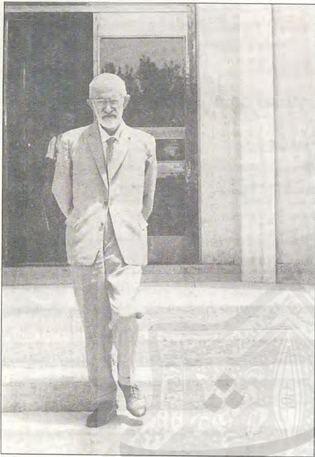
از آخرین عکسهای استاد، در برابر دانشکده ادبیات