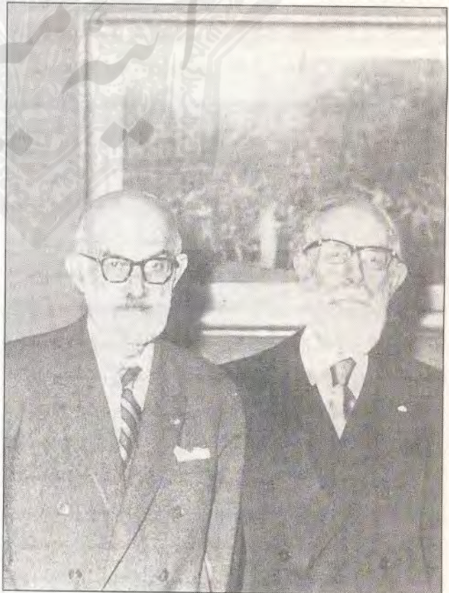
سعید نفیسی در کنار هنری ماسه

بهبترین سالهای عمر خود را صرف خواندن، نوشتن کتب و مقالات مختلف کرد و در مسایل ایرانشناسی تحقیق نمود.