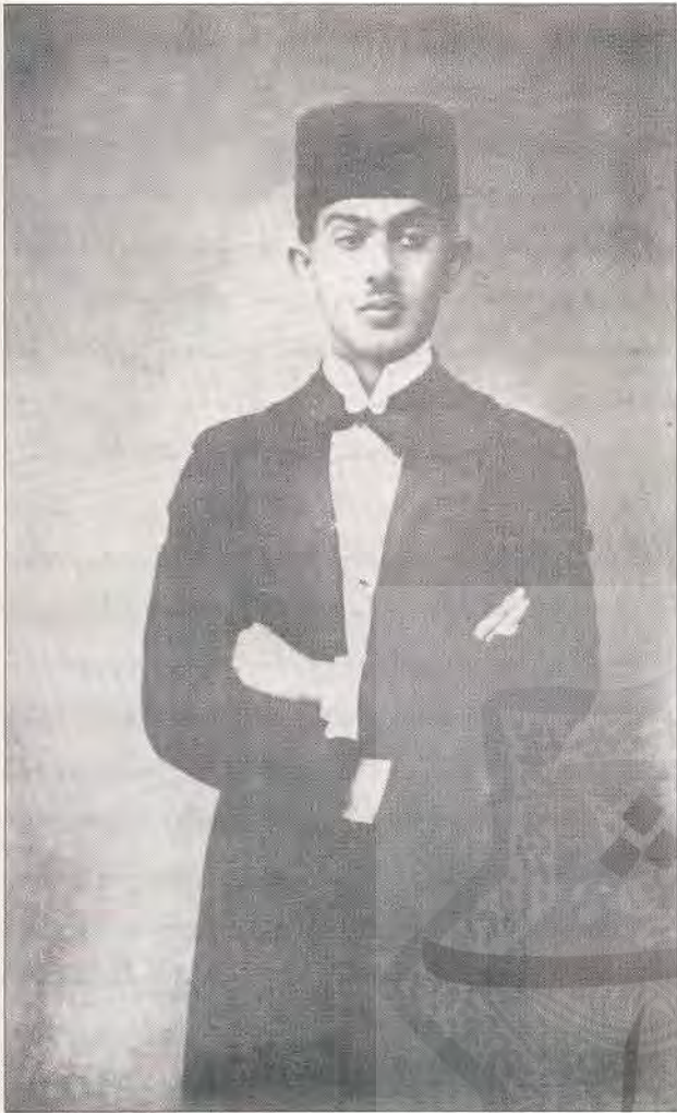
استاد نفیسی در دوران جوانی

به صاحب امتیازی میرزا آقاخان فریبور و نگارندگی سعید نفیسی منتشر شد که در واقع شماره دوم روزنامه امید بود. سرمقاله این روزنامه را معمولاً استاد نفیسی می نوشت.