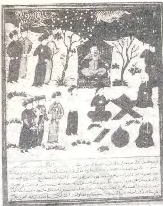
از مجالس نقاشی دستنویس کتابخانه تویقاپوسرای استامبول نشست هلاکوخان و خواجه نصیرالدین طوسی با دانشمندان چینی

هنگامی که به این بخشها از تألیف خواجه رشیدالدین می رسیم، از امانتداری او در ضبط و ثبت مدققانه صاحبان آثار، گرفتار شگفتی فراوان می شویم، چگونه خواجه از نویسندگان و مؤلفان بیگانه با امانت و دقت بسیار یاد می کند و آنگاه که به ضبط و ثبت تاریخ ایران می رسد و با دروغ بسیار، نکته به نکته و مو به مو از مؤلفان فارسی زبان، به عین عبارت می پردازد، از نام بردن منبعهای خود تن می زند و نام هیچیک از منابع خود را باز نمی گوید و بار اتهامی بزرگ را بر دوش می کشد! دو سه گفتار عالمانه استاد شادروان کم مانند مجتبی مینوی گواه این مدعاست، و کس نیست که بخشهایی از تاریخ اسلام و ایران جامع التواریخ را بخواند و از