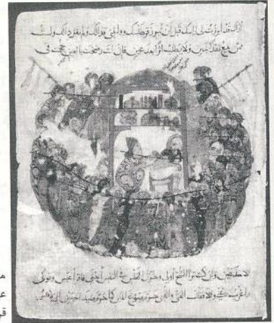
مقامات عراق قرن هفتم هجری

یاد می کند که تألیف آن تمام شده و موضوع آن سیرت مادران خلفاست که خلافت فرزندان خود را در کمر کرده اند. از شیوخ روایت او دانسته می شود که در قرن هفتم هجری می زیسته. در حین تحقیق در سیرت مورخانی که در اخبار مادران و زنان و کنیزان خلفا تألیف داشته اند، بزودی به نام تاج الدین علی بن انجب معروف به ابن ساعی بغدادی متوفای در سال ۶۷۵ هـ در بغداد بر می خوریم. او کتابی به نام من ادرکت خلافة ولدها من نساء الخلفاء تألیف کرده، و کتابی دیگر به اسم جهات الائمة الخلفاء من الحرائر و الاماء تألیف نموده است. این اسم بر نام همین کتابی که نام مؤلفش محو شده درست تطبیق می کند، و شیوخ روایت مؤلف این کتاب، صلاحیت آن را دارند که شیوخ ابن ساعی باشند. بنابراین، کتاب تألیف او است، خصوصاً پس از آنکه بر ما محقق شد که او از شیوخ مذکور در آن کتاب روایت نموده است. ۲۹