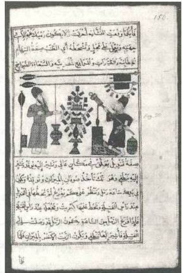
راهنمای هنر سوار کاری مصر یا سوریه قرن نهم هجری