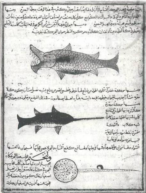
عجایب خلقت ایران یا عراق قرن هفتم هجری