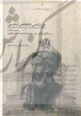
آینه میراث ۳۰-۳۱

متن شناسی شاهنامه: یکی از مباحثی که میراث مکتوب در سلسله انتشارات خود منتشر خواهد کرد، مباحث حوزه متن‌شناسی و نسخه پژوهی است. کتاب متن‌شناسی شاهنامه مجموعه مقالاتی است به کوشش دکتر رستگار فسایی از سوی این مرکز به مناسبت برگزاری همایش متن شناسی شاهنامه در توس و شیراز منتشر شد.