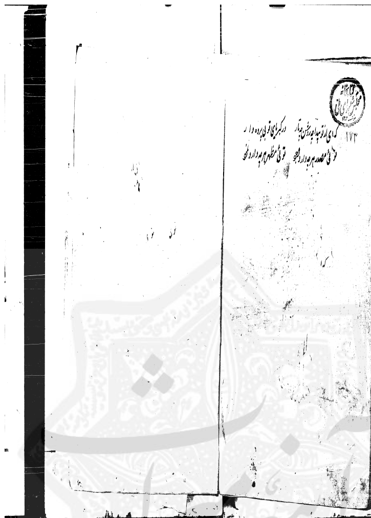
صفحه آخر نسخه مجلس با علامت مج