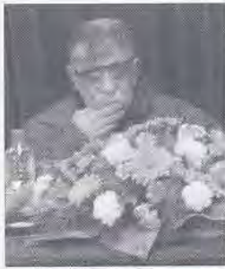
استاد سید عبدالله انوار

خواجه نصیر بین ۱۳۰ تا ۱۳۵ اثر است که ۵ عنوان آن بسیار معروف است. که عبارتند از: اخلاق ناصری، شرح اشارات و تنبیہات، تحریر مجسطی، تحریر اقلیدس و اساس الاقتباس.